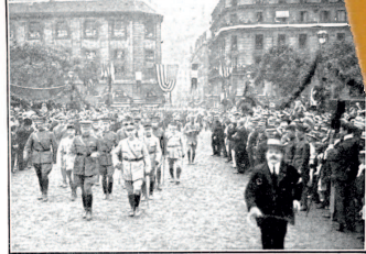
Le cortège, à travers les rues pavées, arrive à l'estrade officielle où des discours furent prononcés.