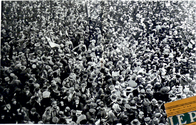
Immense foule de Parisiens célébrant la victoire des alliés. Ils défilent dans toute la France aux marches sur le Paris vaincu par les Allemands. Le 14 juillet, devant le "Matin", une foule immense acclame la victoire. Le 14 juillet, devant le "Matin", une foule immense acclame la victoire. Le 14 juillet, devant le "Matin", une foule immense acclame la victoire.